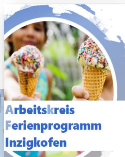
Arbeitskreis Ferienprogramm Inzigkofen